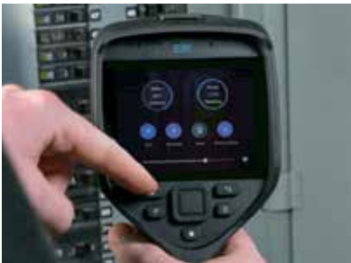
Rationalisierte Erfassung und Weitergabe von Daten zur Beschleunigung von Analyse und Reparatur