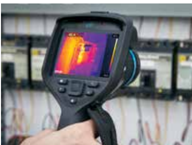
Einhändige Bedienung über komfortable Tasten zur Unterstützung der Sicherheit am Arbeitsplatz