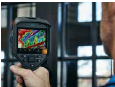
Einhändige Bedienung über komfortable Tasten zur sicheren, bequemen Nutzung