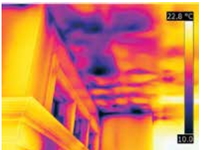
Schnelle Erkennung von Feuchtigkeit und Gebäudemängeln